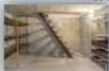
подвалы и подпольные этажи зданий, включая частный жилой сектор