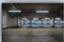
гаражи, складские и другие помещения, расположенные в отдельно стоящих и индивидуальных этажах зданий и сооружениях, в т.ч. в торговых и развлекательных центрах