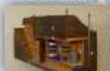
престроенные укрытия (или отдельные их части), приспособленные под гаражи, подполья и т.п.)