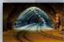
транспортные сооружения городской инфраструктуры (автомобильные и железнодорожные (трамвайные) подземные тоннели, подземные переходы и т.п.)